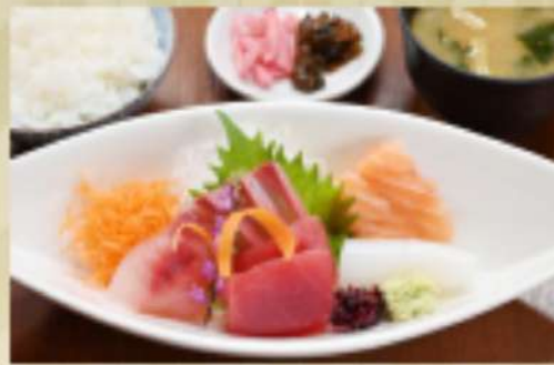
刺身定食 1,900円 華品1,500円