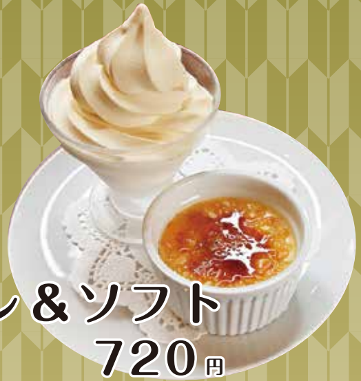
クリームブリュレ&ソフト 720円