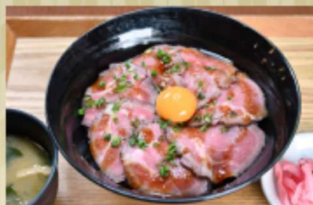
ローストビーフ丼 2,000円