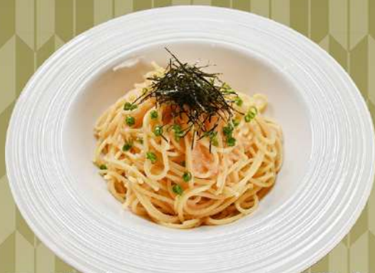
スパゲッティ和風明太子 1,000円