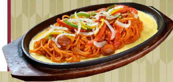
スパゲッティ焼きナポリタン 1,300円