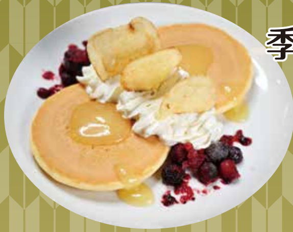
季節のパンケーキ 900円