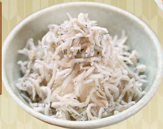
釜揚げシラス&大根おろし 400円