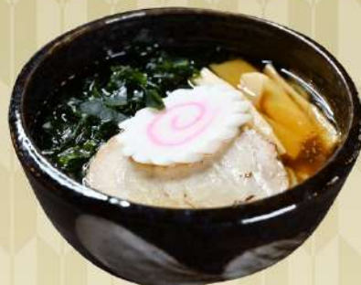
キッズラーメン 600円