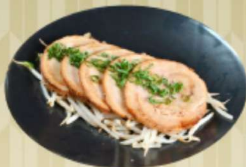
炙りチャーシュー 900円