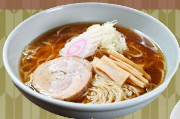
しょうゆラーメン 900円