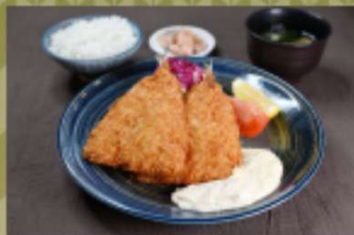
アジフライ定食 1,350円 華品1,050円