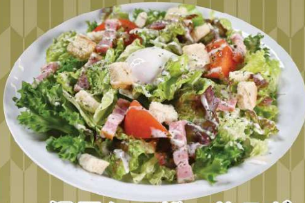
温玉シーザーサラダ