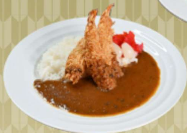
海老フライカレー 1,400円