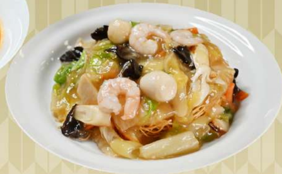
たっぷり野菜のかた焼きそば 1,400円