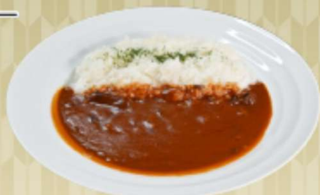
ハッシュドビーフ 950円