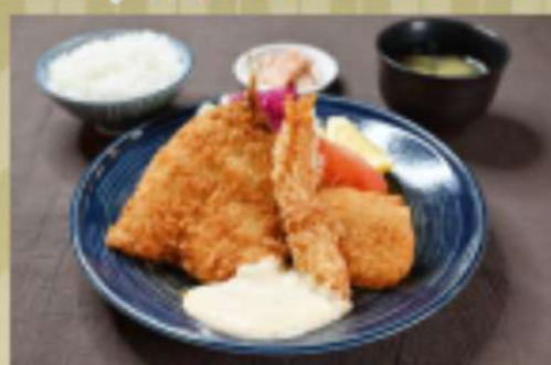
ミックスフライ定食 1,500円 華品1,150円