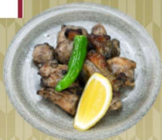
鶏肉の備長炭焼き 850円