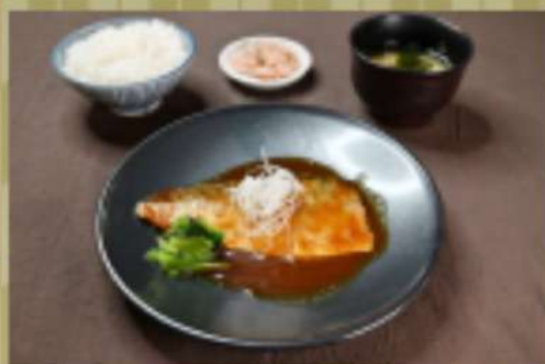
さば味噌煮定食 1,400円 華品1,050円