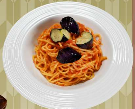
スパゲッティ ピリ辛茄子の トマトソース 1,000円