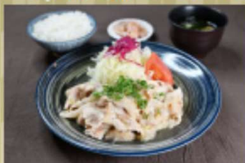
ねぎ塩豚カルビ定食 1,450円 華品1,100円