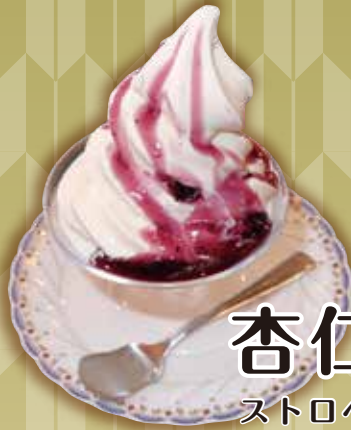
杏仁ソフト 580円 ストロベリー・ブルーベリー・マンゴー