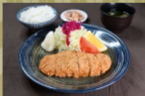
おろしとんかつ定食 1,400円 華品1,150円