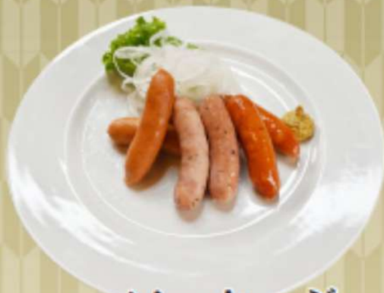
ソーセージ 盛り合わせ 900円