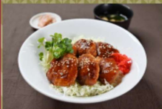
豚ヒレソースカツ丼 1,450円