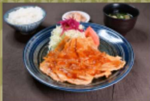
生姜焼き定食 1,350円 華品1,050円