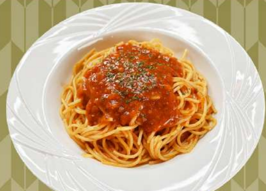
スパゲッティボロネーゼ 1,000円