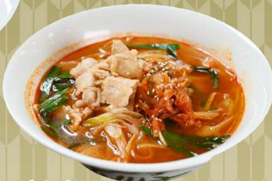
旨辛キムチラーメン 1,300円