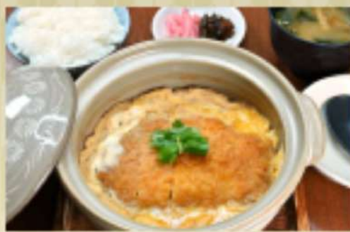
とんかつ煮鍋定食 1,500円 華品1,150円