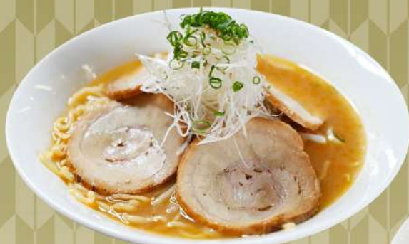
ネギチャーシュー 味噌ラーメン 1,300円