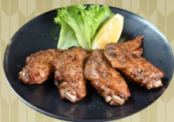
手羽先の スパイシー黄金焼き 850円