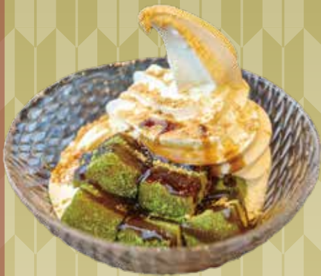
抹茶わらび餅ソフト 600円